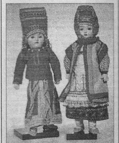
Куклы в костюмах Рязанской и Саратовской губерний. 1891-1913 гг., Сергиев Посад.